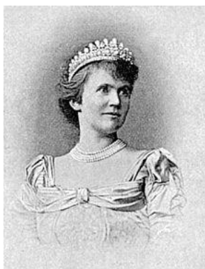
Elisabeth zu Wied

Ilustr. 94 przedstawia pismo rumuńskiej królowej Elżbiety 1 , wyrafinowanej i subtelnej poetki piszącej pod pseudonimem Carmen Sylva, co do której nikomu nie przyszłoby na myśl skojarzenie z nią nawet jednej z wymienionych cech. Również hrabia Graf von Zeppelin łączył swoje wiązania girlandowe z tego rodzaju arkadami (ilustr. 74, tablica XVIII), a wraz z nim również inne osoby o nienaganej moralności, wobec których wspomniane właściwości nie mogą się w żaden sposób odnosić.